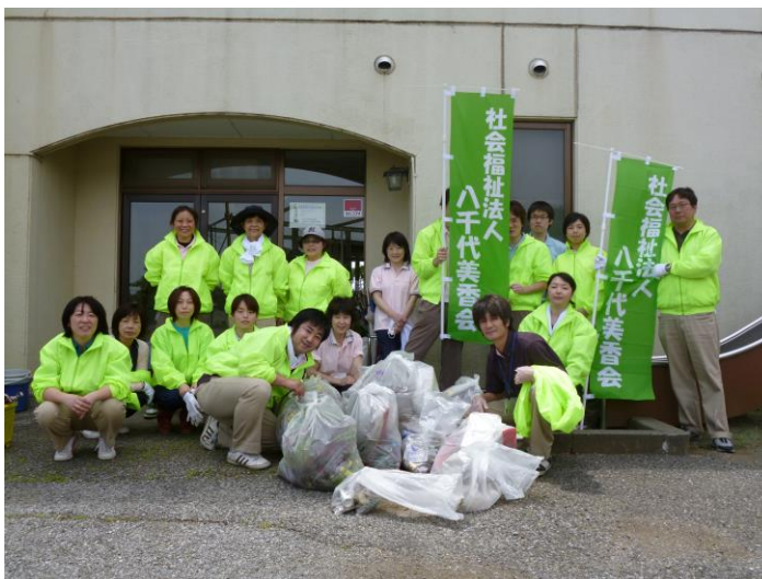
地域貢献もしています