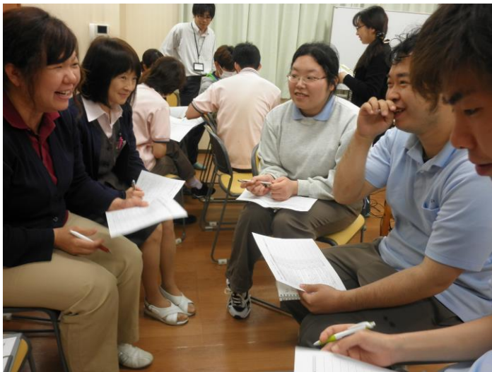
定期的に研修にてスキルアップ