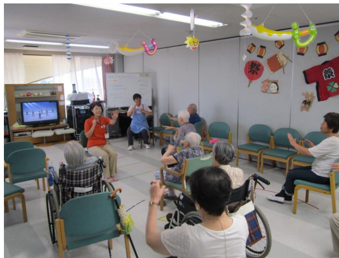
デイサービスにて一緒に運動